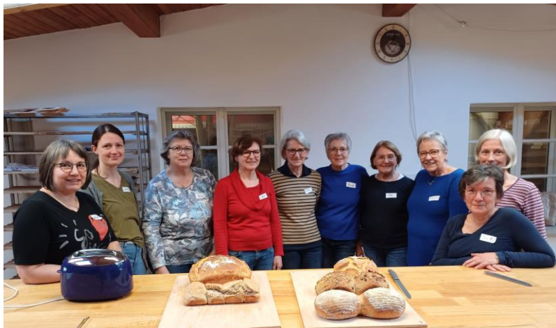
Brotback-Kurs – sehr schmackhaft!