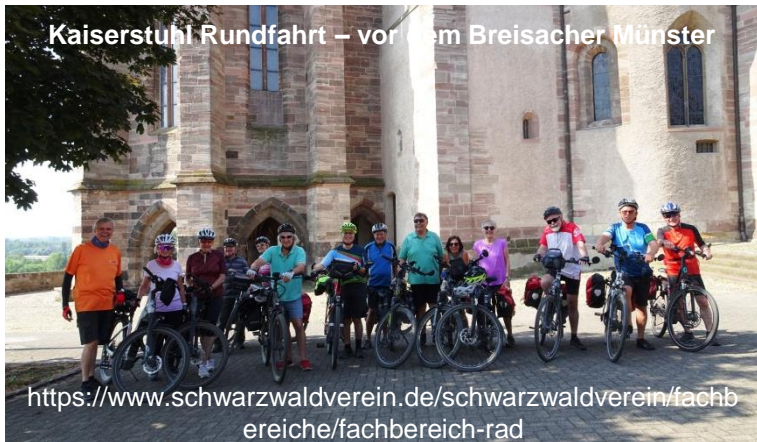
Kaiserstuhl Rundfahrt – vor dem Breisacher Münster