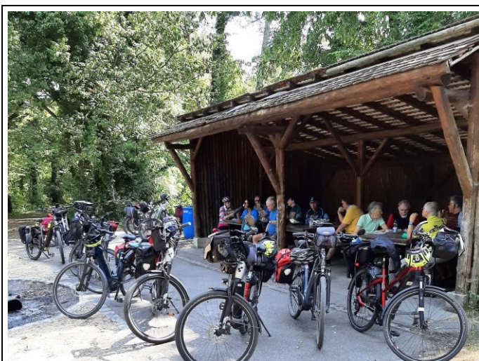
Die Rast im kühlen Walde