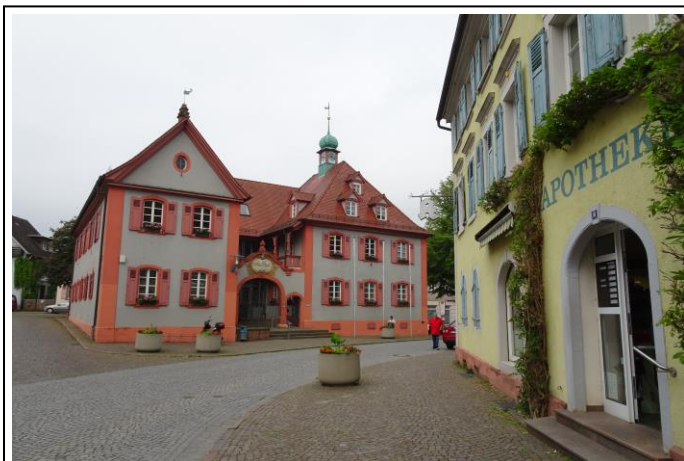
Rathaus in Riegel

Sonnig und noch etwas frisch begann der Tag mit einer Stippvisite beim Badischen Winzerkeller bevor wir dann die steile Pflasterstraße hoch zum Breisacher Münster radelten. Das Münster lohnt den Besuch! Nicht nur, weil Erwin von Steinbach am gotischen Teil der Kirche mitgewirkt hat, sondern auch wegen der Wandmalereien im Innern und dem geschnitzten Altar um 1500, der zu den bedeutendsten Kunstwerken Deutschlands zählt. Der Festungsberg beherbergt darüber