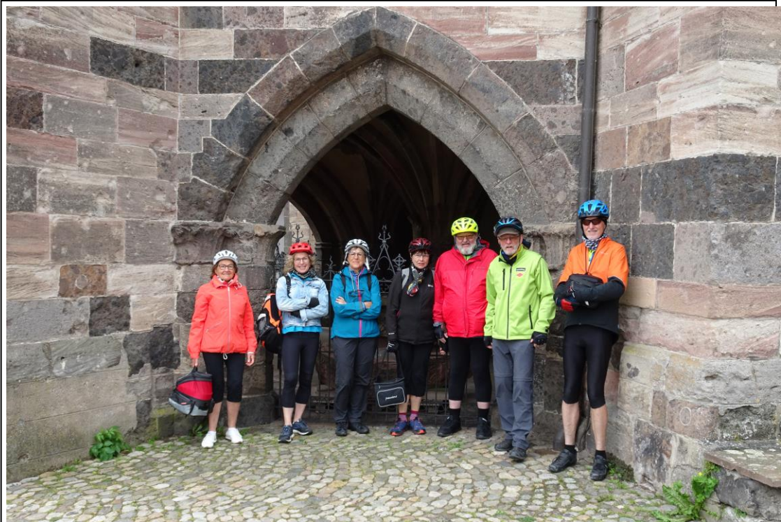
Die Vortourer vor dem Breisacher Münster mit dem gotischen Teil aus der Feder Erwin von Steinbach (23./24. Mai 2023)