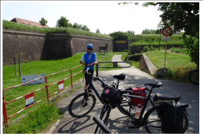
Die mächtigen Wälle