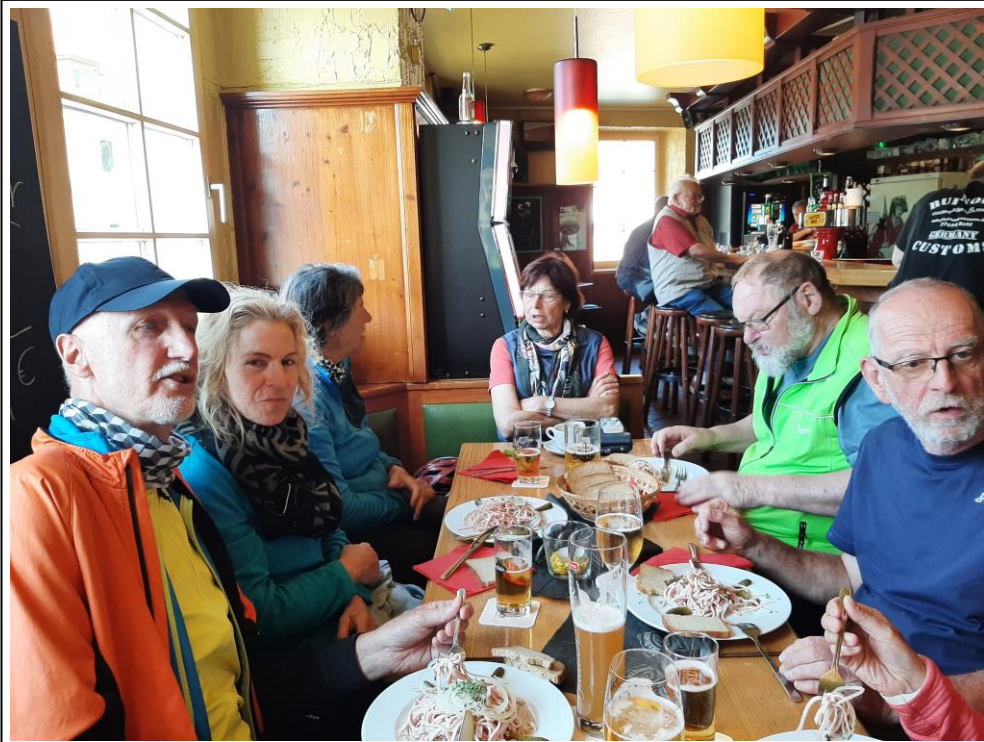
Abschluss, hier in einer Kneipe in Lahr mit, traditionell !, Wurstsalat