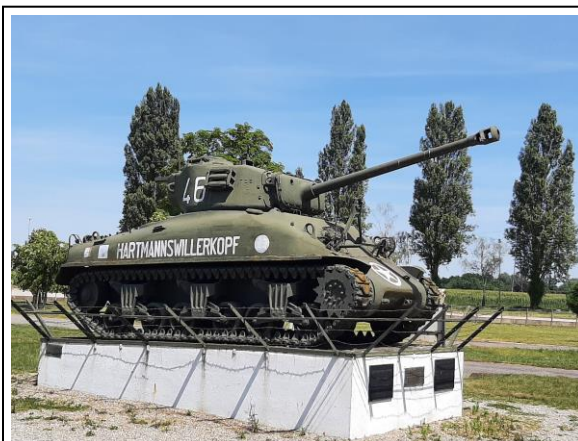
Bei den Kasematten von Marckolsheim – eine Erinnerung an die Diktatur