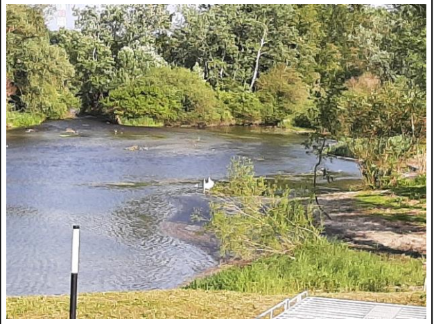
Der Blick aus dem Hotelzimmer