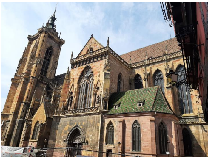
Stiftskirche St. Martin in Colmar