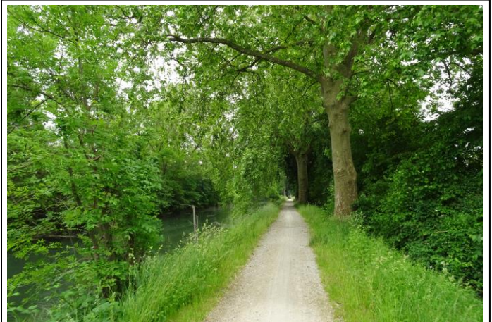
Am Kanal entlang