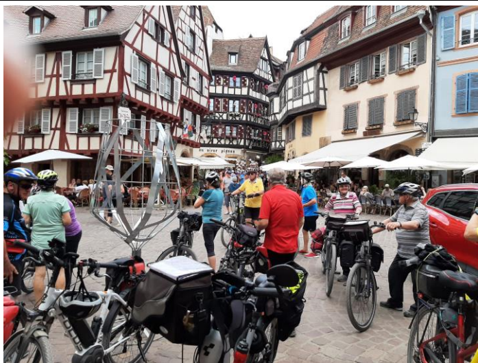
Fachwerk pur, rechts, das Hansi Haus; Hansi (1873 – 1951), ein Zeichner, der die Deutschen auf's Korn nahm und deshalb von diesen verfolgt wurde.