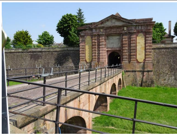
Die gewaltige Festung Neuf-Brisach – die Gegenfestung zur Festung Breisach