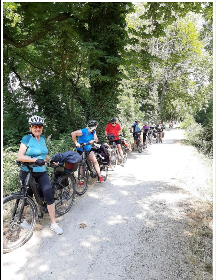
Beschauliches Dahinradeln unter alten Bäumen