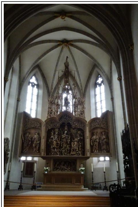
Der gotische Chor mit dem geschnitzten Flügelaltar