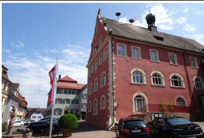
Das Rathaus in Ettenheim