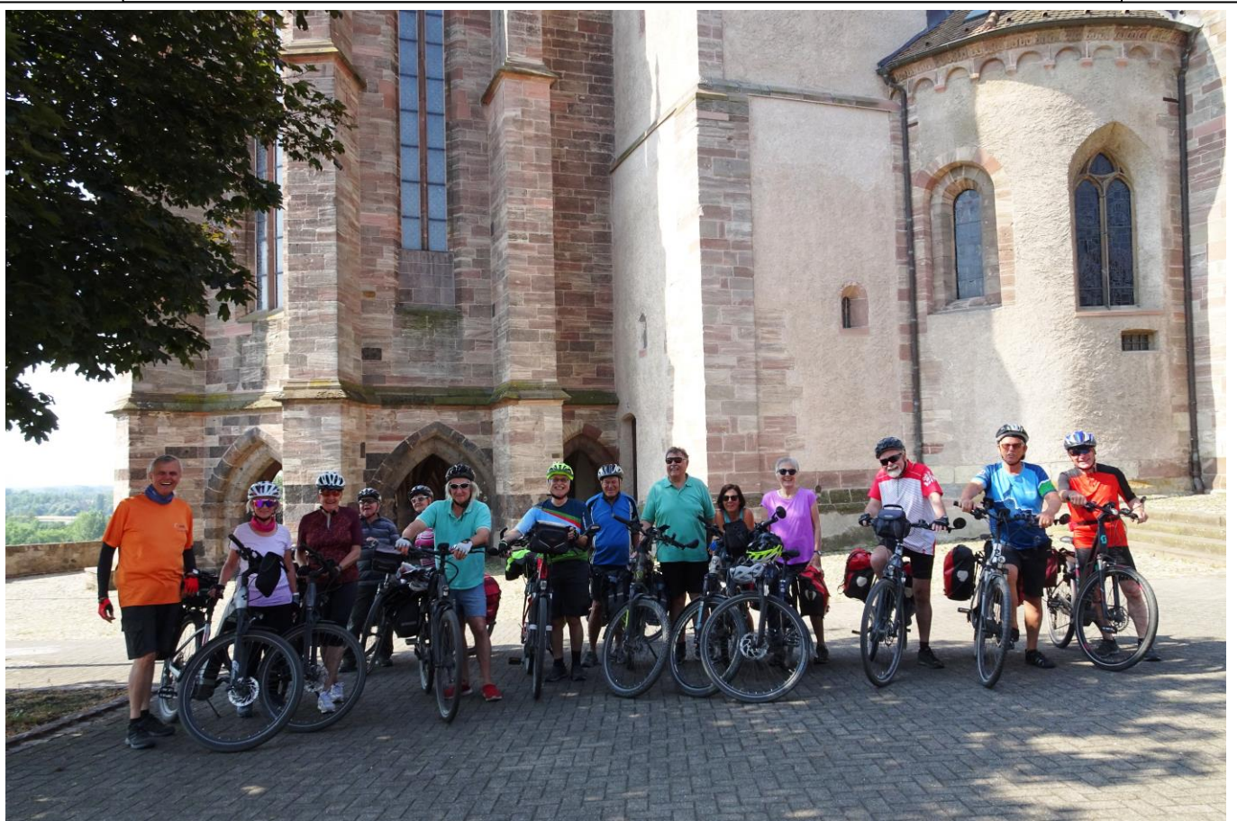
Die Nachtourer (16./ 17.Juni 2023)

Baden und Elsass verbindet eine jahrtausendalte Geschichte, mal gehörte alles zusammen, mal brachten sich die Menschen auf Befehl unserer Diktatoren gegenseitig um. Sind wir dankbar für unsere mittlerweile doch sehr lange Freundschaft!