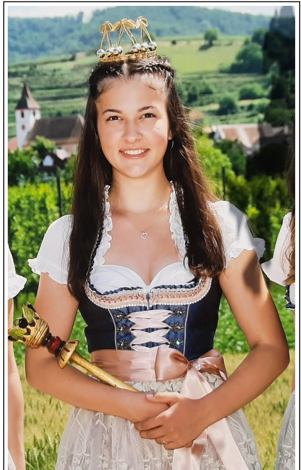
Die Kirschenkönigin 2022, sie bediente uns