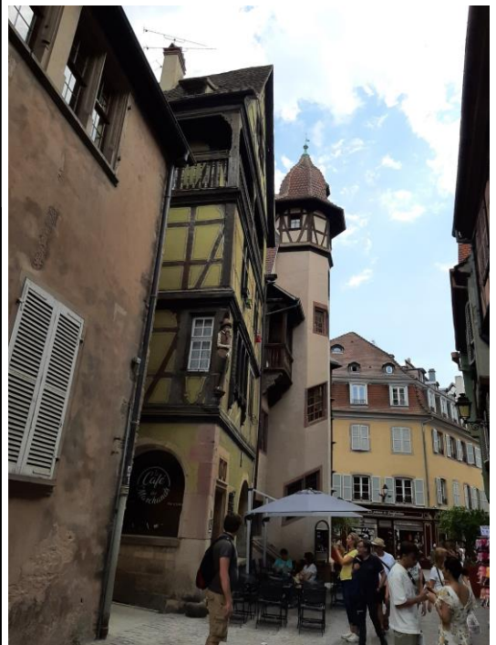
Das Pfister Haus