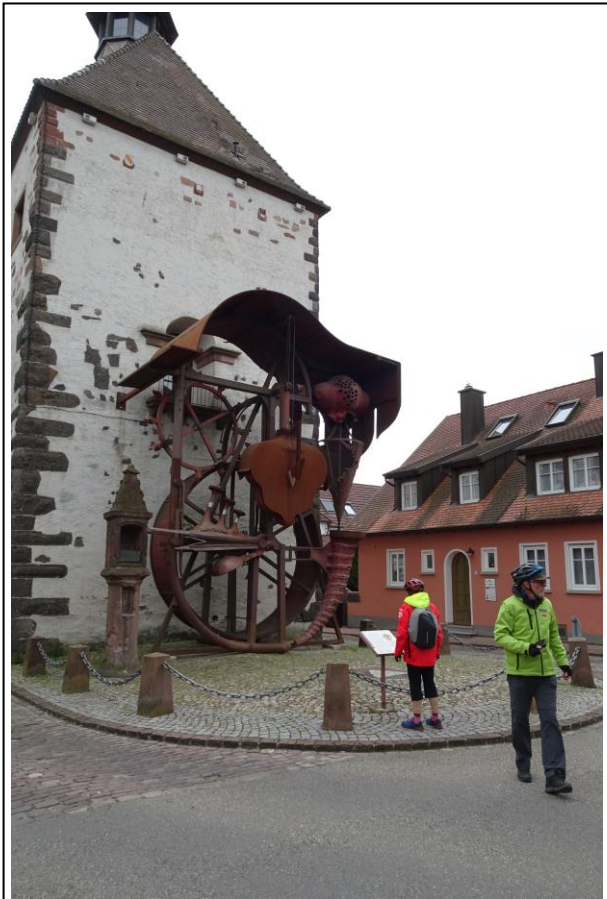
Der Hagenbachturm in dem ein denkwürdiger Gerichtsprozess stattfand, heute Kunstmuseum