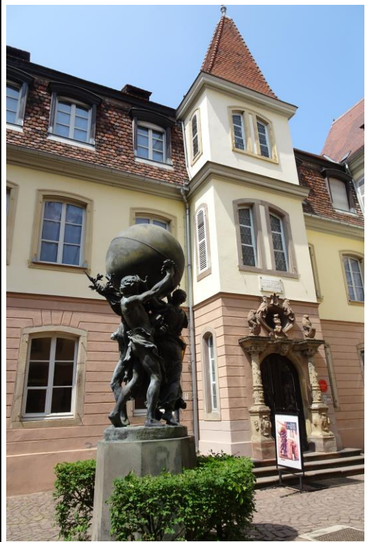
Bartholdi Museum, Designer der Freiheitsstatue in New York