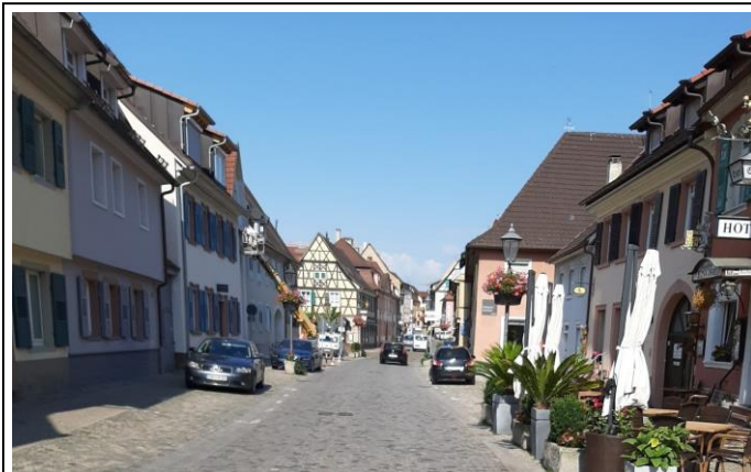
Endingen a. K.