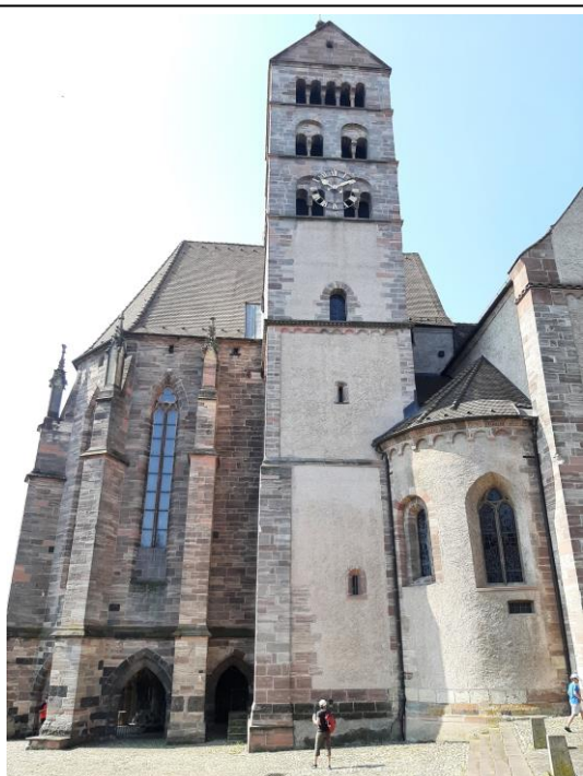
Das gotisch/ romanische Breisacher Münster