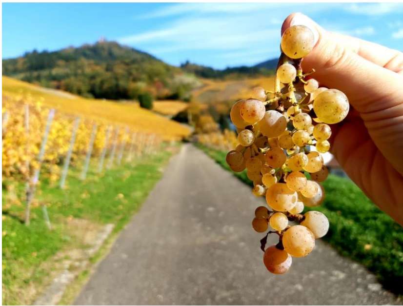
Weinland = Traumland, im Hintergrund die Yburg