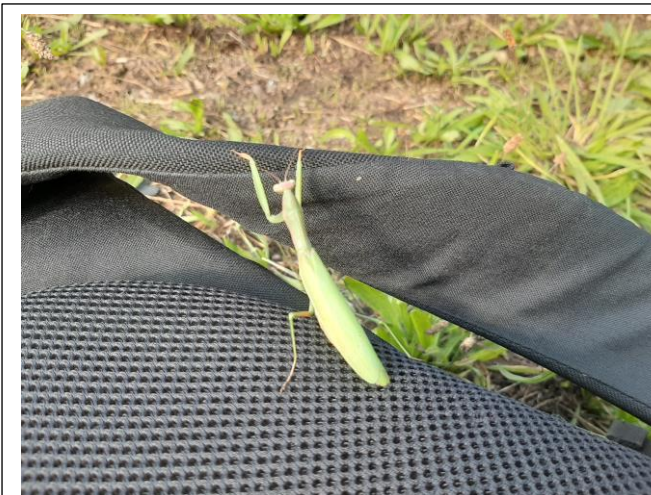
Gottesanbeterin, entdeckt am Mauerberg