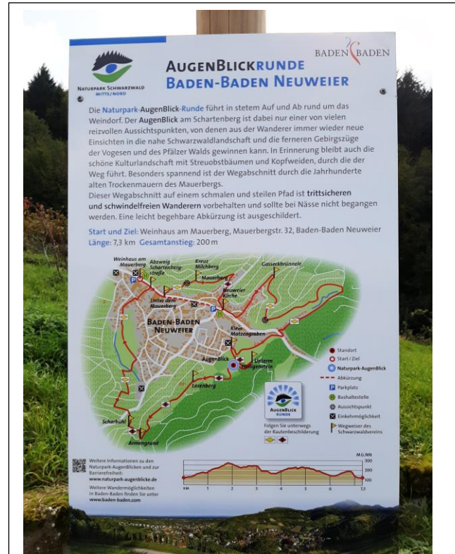
Die Wanderkarte am Augenblickpunkt oberhalb vom Heiligenstein

Er bietet wunderschöne Ausblicke bis weit in die Vogesen und den Schwarzwald. Die Wanderroute ist abwechslungsreich und mit etwas Glück können Sie das eine oder andere Naturwunder entdecken. Alle Augenblickpunkte finden Sie im Internet unter https://www.naturpark-augenblicke.de/augenblicke/badenbaden.html