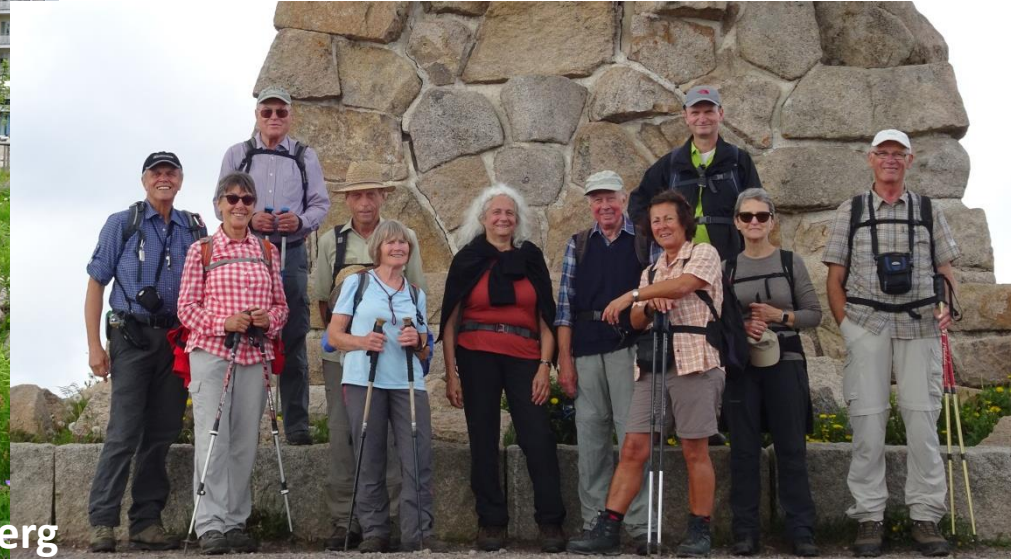
Der Feldberg die Gipfelstürmer