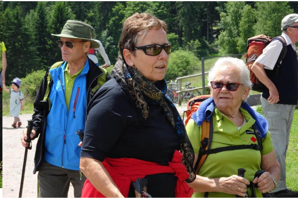
Schluchsee und Unterkrummenhof Vorbei an geheimnisvollen Steinkreisen