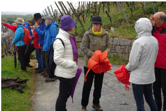
Auf dem Historischen Weinpfad im Rebland gibt's was zu sehen