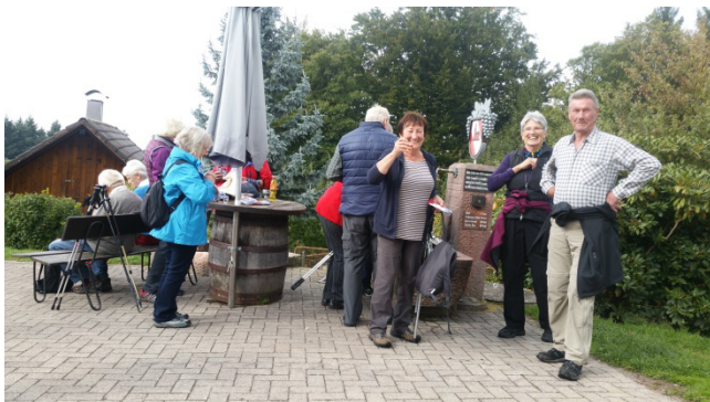
Auch in Sasbachwalden lässt man sich's gut gehen!