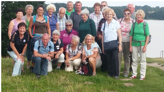
Die fidelen Wanderer an der Schlei