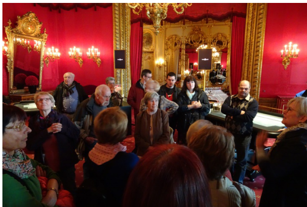
Im Spielcasino in Baden-Baden