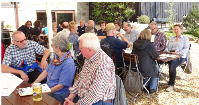
Beim Jubiläumsausflug auf der Heuchelberger Warte