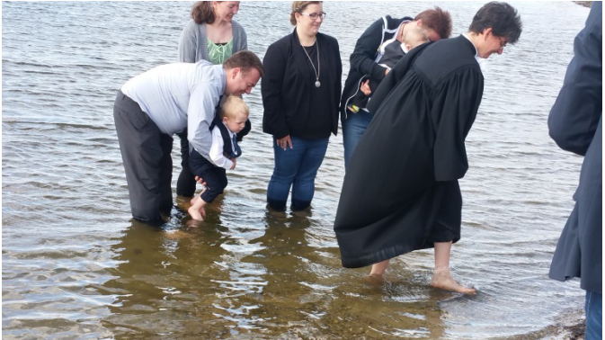
Eine Wassertaufe an der Schlei