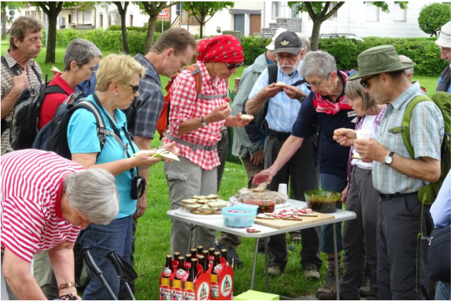
Bewirtung durch den Schwäbischen Albverein – das hat geschmeckt!