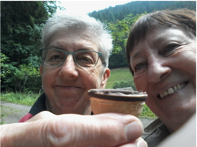
27 Auf dem Mönchsweg lässt sich's leben